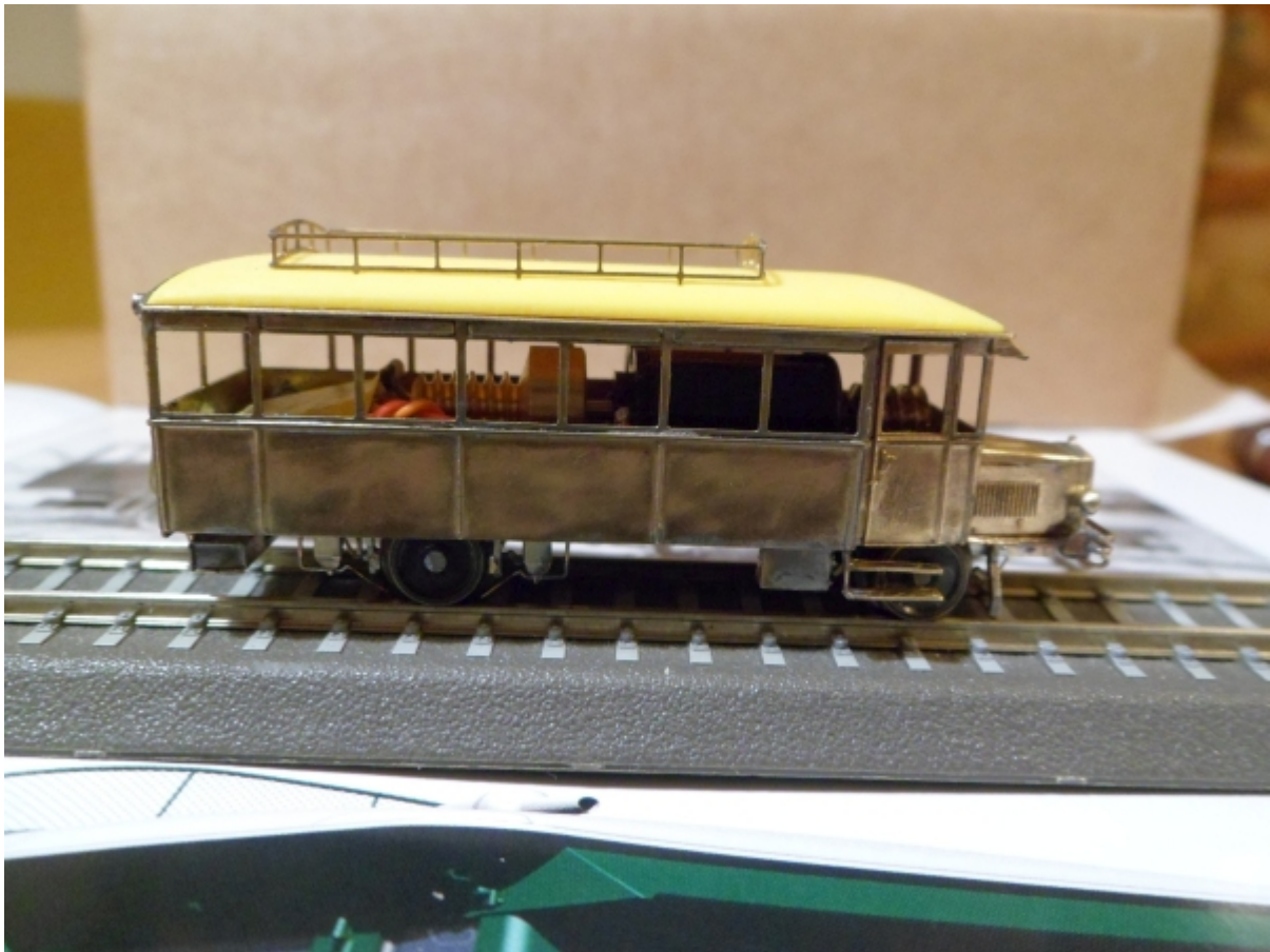
Akumulátorové lokomotivy 103 ČD